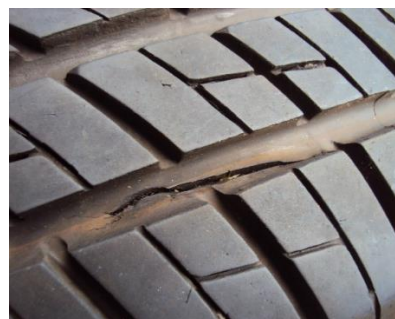
Imagem 4: Exemplo de corte na banda de rodadura.

Evitar daños como estos no siempre es posible, pero algunos cuidados pueden minimizar los daños y disminuir los riesgos de las ocurrencias: evitar el frenado repentino, maniobras muy cerradas, contactos con bordillos, pasar con el vehículo en baches o daños en la carretera, siempre viajar en la velocidad indicada por la vía, reducir la velocidad en pistas mojadas y etc. En vehículos estacionados, también existe la posibilidad de la acción de vandalismo. Por el hecho de ser daños causados por objetos externos, o por la mala aplicación del producto, estas condiciones no son pasibles de garantía.